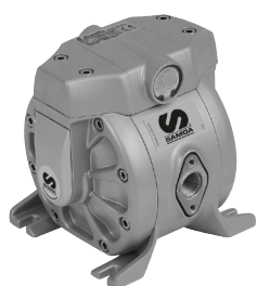
Pompe pneumatique à membranes