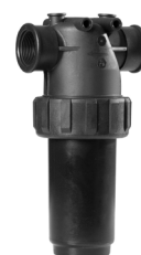
Filtre huiles usées