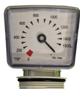
Jauge de niveau